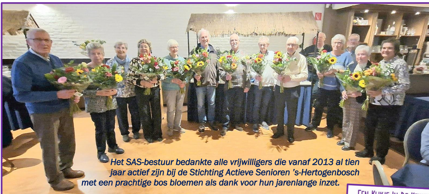
Het SAS-bestuur bedankte alle vrijwilligers die vanaf 2013 al tien jaar actief zijn bij de Stichting Actieve Senioren 's-Hertogenbosch met een prachtige bos bloemen als dank voor hun jarenlange inzet.