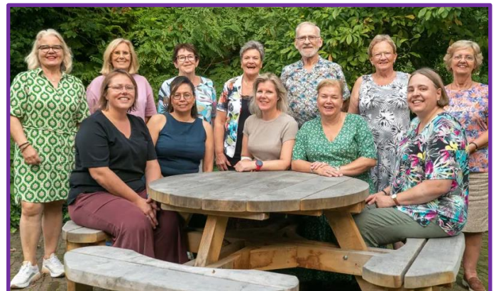
Een deelnemersgroep van de Galant Vrijwilligersacademie: allemaal Bossche vrijwilligers!