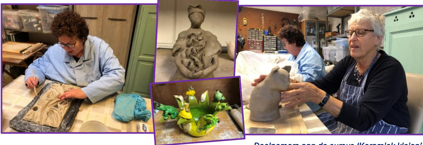
Deelnemers aan de cursus 'Keramiek kleien'.