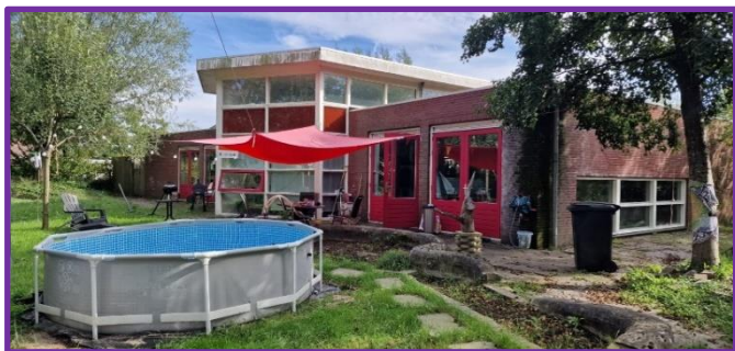
Het Kinderdagverblijf Gaasterland, de locatie van het toekomstige woonproject Buurtvrienden Gaasterland, wordt nu tijdelijk anti-kraak bewoond.

Professionals van Kilimanjaro begeleiden waar nodig het proces van ontwerpen, aanbesteden van de aannemers en het duurzaam en energieneutraal opleveren van het bouwproject.