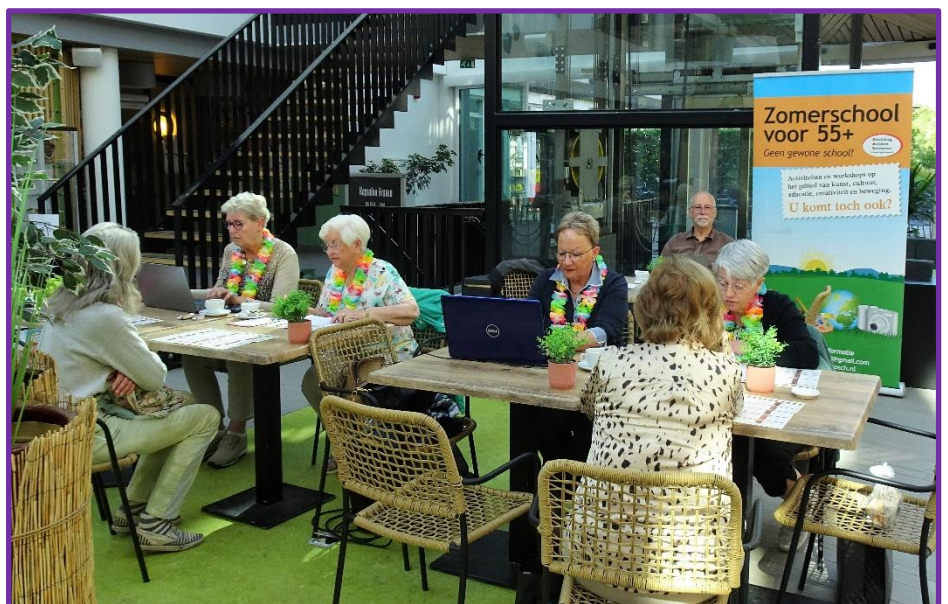
Op 20 mei startte de inschrijving voor de Zomerschool in 'De Biechten'.

Ook de Zomerschooltelefoon rinkelt, maar helaas... De mensen aan tafel gaan voor en degene aan de telefoon moet dus even wachten. Gelukkig hebben we de formulieren genummerd en kunnen we dus eerlijk op volgorde van binnenkomst werken: 'Nummer 37!' klinkt het door het Atrium en als je niet beter wist, waande je je bij de dokter.